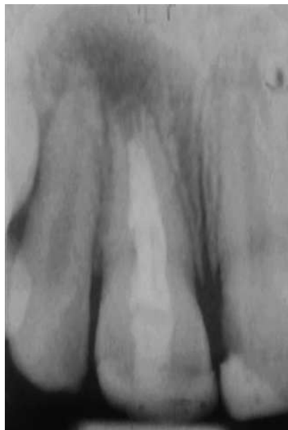
Abb. 3 Zahnabszess nach 11 Monaten homöopathischer Behandlung. 19.02.2009: Die Demarkation der Abszesshöhle ist verschwunden. Der Substanzdefekt beginnt, sich mit Spongiosa zu füllen.

Vorgehen bei Symptomenmangel. Da bei Zahnleiden oft nur wenige Sympto-