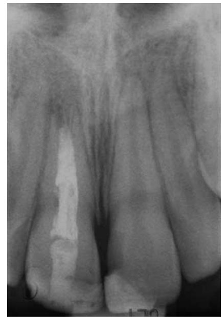
Abb. 4 Röntgenkontrolle 1 Jahr nach Abschluss der homöopathischen Behandlung. 12.02.2010: Der Substanzdefekt ist völlig verschwunden. Die Abszesshöhle hat sich mit Spongiosa gefüllt und der Zahn ist wieder normal verankert.

me vorhanden sind, kann die Mittelbestimmung schwierig sein. Der Symptomenmangel führt in der Regel zu größeren homöopathischen Differenzialdiagnosen mit mehreren Arzneimitteln, die alle Symptome des Patienten abdecken.